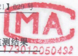
表 4-3 海原县工贸物流园区宇涛供暖有限公司北区供暖锅炉废气监测结果